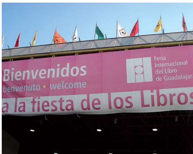
Acceso Principal de Expo Guadalajara.