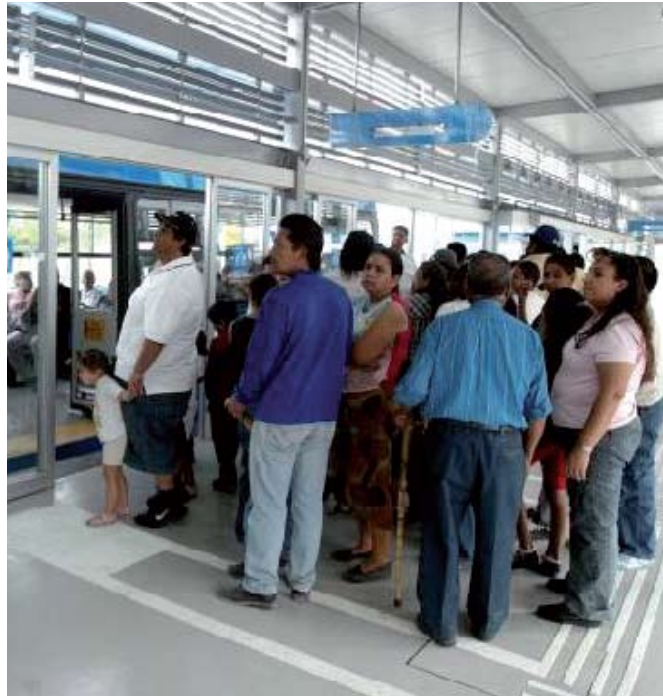
Usuarios del Macrobus.

El Estado de Jalisco representa la cuarta economía en todo México; con una población total cercana a siete millones de habitantes, de los cuales, el 61% aproximadamente, casi 4.3 millones de habitantes, se encuentra concentrado en la Zona Metropolitana de Guadalajara (ZMG), misma que ocupa el segundo lugar dentro de las zonas metropolitanas más pobladas de nuestro país.