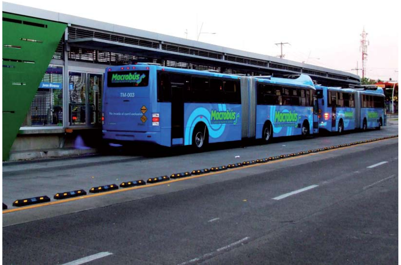
Tras los estudios efectuados el Macrobus es una realidad compatible con todos los sistemas de movilidad urbana.

Guadalajara, Jalisco. Logra consolidar un nuevo sistema de transporte al mismo tiempo de reordenar contextos urbanos con 20 años de inamovilidad por parte de Gobierno y Transportistas