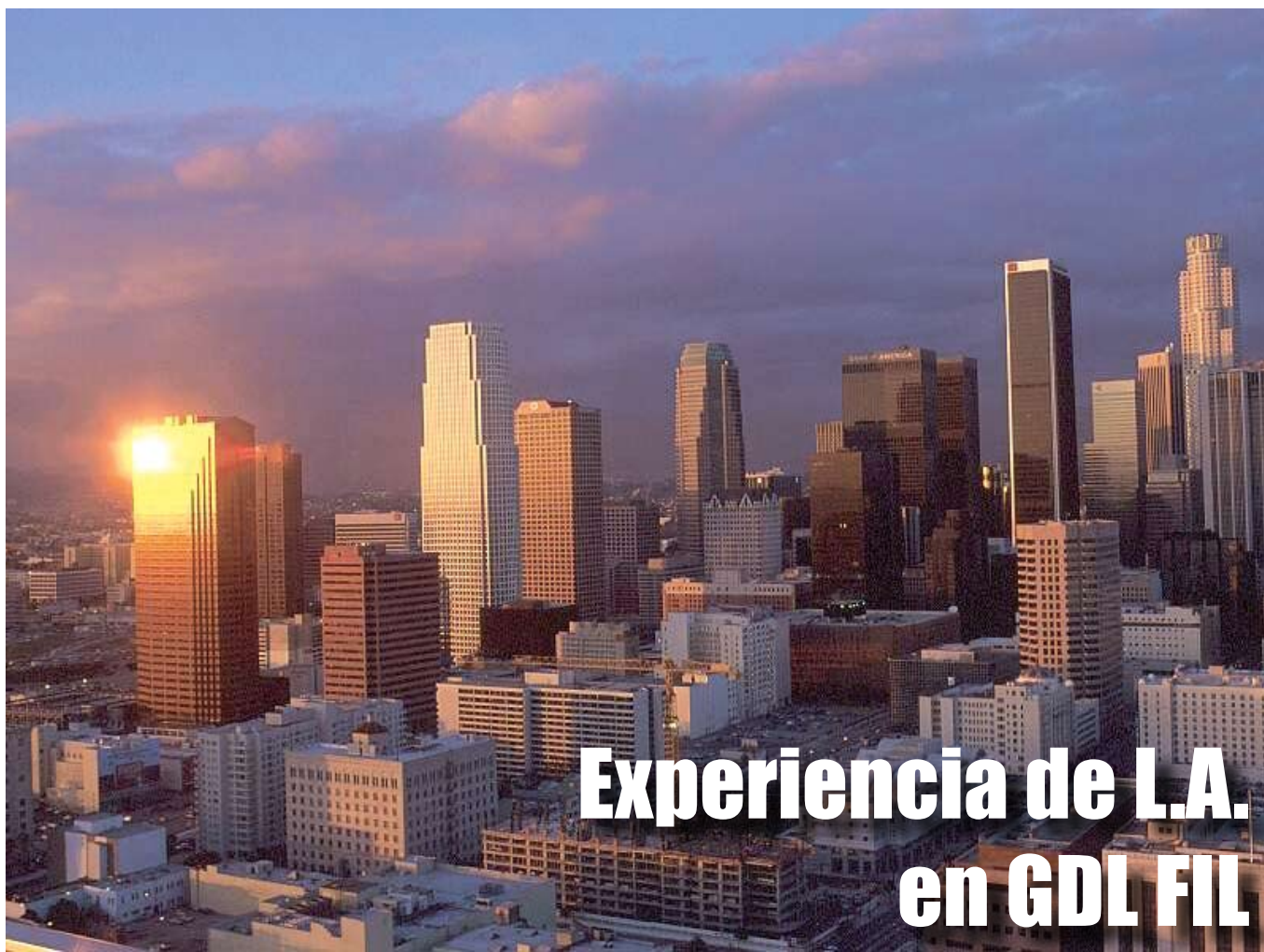
Ejemplo de fronteras, migraciones y evoluciones, L.A. in GDL.

Entre los plus que se ofrecen este año, estuvo una venta nocturna en donde diversas editoriales, ofrecieron sus títulos a precios especiales. También se contó con la visita del Novel de Literatura 2006, Orhan Pamuk, y una transmisión vía satélite con el creador de "Fahrenheit 451", Ray Bradbury.