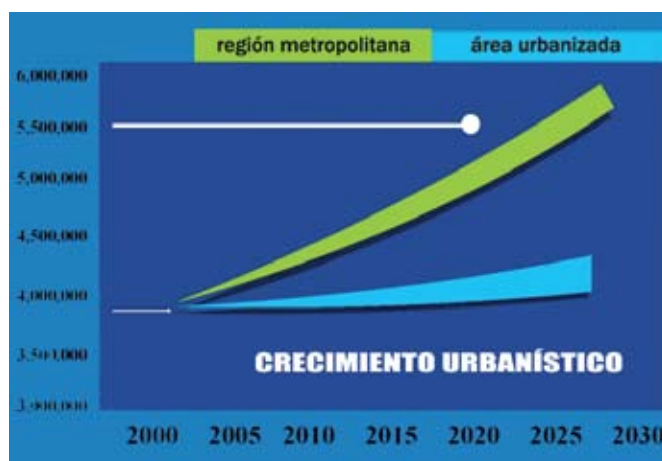
Valores intermedios de crecimiento. Modelo estadístico.

El acelerado crecimiento del parque vehicular, una grave falta de cultura vial, precios elevados en los estacionamientos y la ignorancia e irresponsabilidad de los ciudadanos, son unos de los factores que si no se corrigen, "colapsarán la ciudad en aproximadamente 20 años.