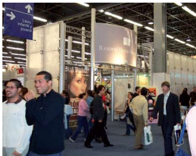
Aspecto de Interiores de la FIL.