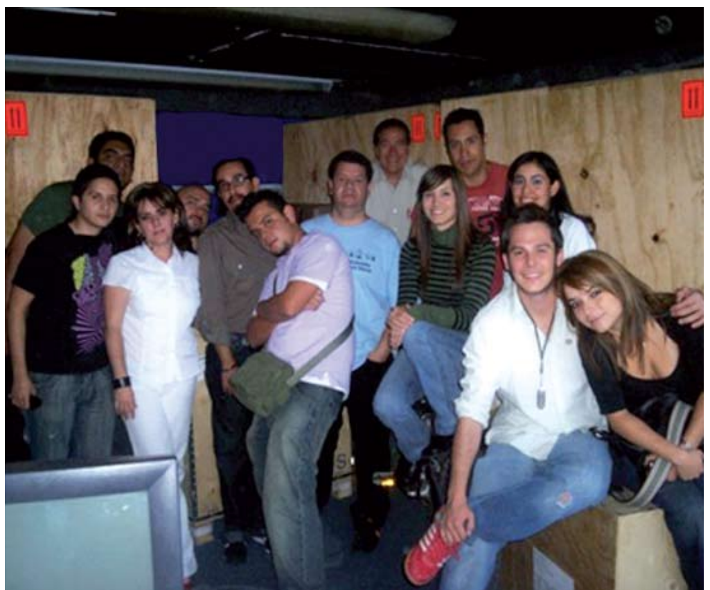
Locutores y equipo de RMX.

Posteriormente, al finalizar la carrera comienza su colaboración en la radio, desempeñando actividades como comentarista de fútbol, actividad que sin duda le representa una enorme satisfacción.